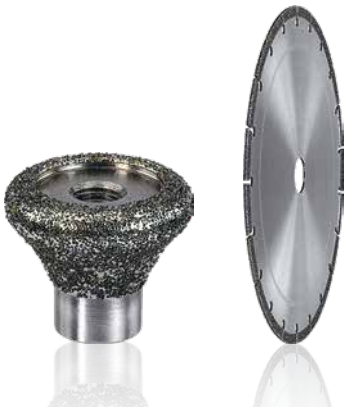
Schleif- und Abrichtwerkzeuge nach Mass entwickelt Reishauer in enger Kooperation mit dem jeweiligen Kunden.