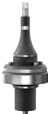
ライスハウークランプ装置 DH16.707