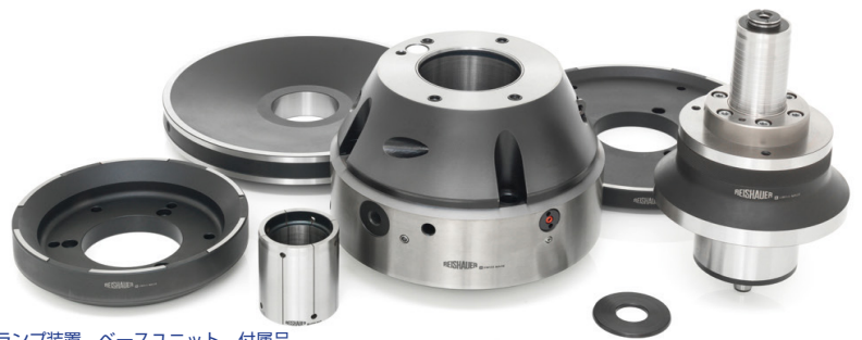
クランプ装置、ベースユニット、付属品