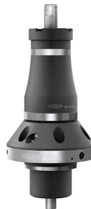
ライスハウークランプ装置 DH19