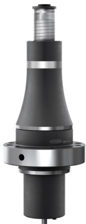
ライスハウークランプ装置 DH30